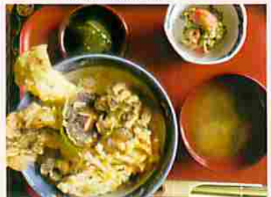
魚沼きのこのどかもり天井

新潟県南魚沼郡湯沢町湯沢1-1-2 TEL.025(784)2881 FAX.025(784)2955