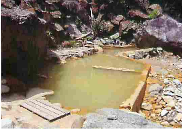
清津川に沿って3つある温泉のひとつ「玉子湯」。隣接する半露天の「栗師湯」、さらに下流には昼間は女性専用の「青湯」がある。日帰りもできるが、どれも泉質が異なるので宿泊してゆっくりと浸かりたい。(赤湯温泉)

この温泉の魅力はなんといってもやわらかな泉質で、化粧水の代わりに使われているほど。32・1度と体温より低い温度のラジウム泉は夏以外はぬるいというより冷たい。湯船に入るのには勇気がいるほどだ。しかし、意を決して浸かっていると体がはかばかと温まってくるのが実感できる。じんわりとした優しい温かさだ。しかも、ぬる湯だからこそ湯疲れすることなくじっくりと長湯が楽しめる。温泉成分を体に取り入れることができる。脱衣所の壁に