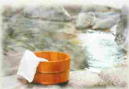
温泉入浴は手軽な健康法。