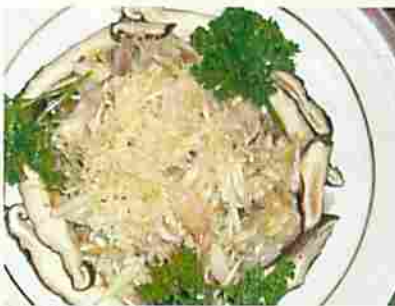
ミョウガといたけのサラダ

新潟県南魚沼郡湯沢町土樽232 TEL.025(787)3047 FAX.025(787)5098