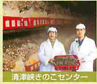
清津峡きのごセンター