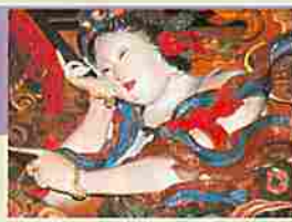
石川雲蝶作 天女/永林寺