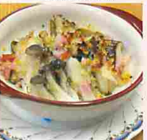
魚沼きのこ香味焼

新潟県南魚沼市目来田155-18 (つむぎの里敷地内) TEL.025(782)5161