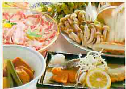
越後もち豚と魚沼きのこのしゃぶしゃぶ

新潟県南魚沼郡湯沢町三国438-79 TEL.025(789)2241 FAX.025(789)2371