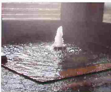
肌を包み込むようなやわらかな湯は常連客の間では「化粧水いらず」と評判。源泉を持ち帰り肌につけている人もいほどだ。(駒の湯温泉)

3代将軍家光の時代に銀が採掘されはじめ、鉱山の町として栄えた銀山平。小出から銀山平への道には多くの温泉が点在する。そのひとつ駒の湯温泉は銀山最盛期の1700年頃、発見された湯である。当時は小出から物資を馬の背に乗せ運んでいたが、その馬引きが銀の道への入口にあたる枝折峠(しおりとうげ)の登り口、佐梨川の河原で服した。その際に温泉らしきものを見つけ、物資運搬の行き帰りにこの湯で疲れを癒したという。