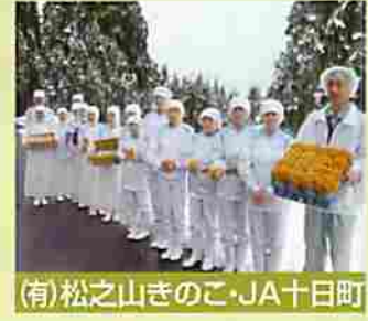
(有)松之山きのご・JA十日町