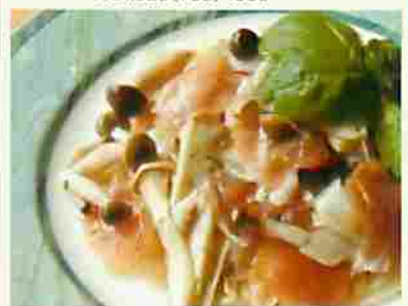
魚沼きのこのマリネ

新潟県南魚沼市石打1700-2 TEL.025(783)2171 FAX.025(783)4556