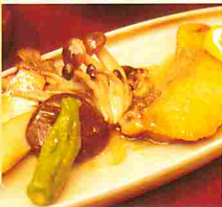
魚沼きのこ美雪ますのムニエル (要予約)

きのこはどんな料理とも相性が良い食材だ。普段から何気なく食べている人も多いことだろう。でもきのこのおいしさを本当に知っているだろうか。おいしいきのこは新鮮さが決め手！鮮度で味も食感もまるつきり違う。魚沼では地の利を活かして新鮮な「魚沼きのこ」と地域食材でこしらえたご馳走を食べさせてくれるお宿やお店がある。その中からいくつか紹介したい。