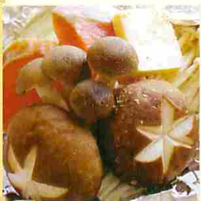
うおめま焼き (魚沼きのこ魚沼美雪ますのホイル焼き)